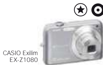
CASIO Exilim EX-Z1080

Además, en www.ocu.org > Análisis comparativos > Tecnología y comunicación > Cámaras digitales, podrá ver de forma más detallada las características de estos modelos, junto con los de anteriores análisis.