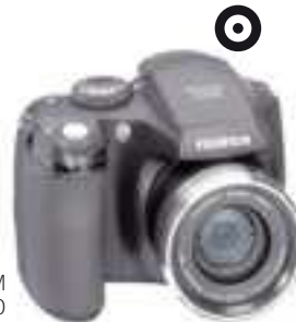
FUJIFILM FinePix S5800