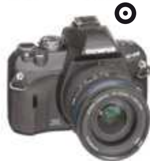
OLYMPUS E-410 Kit + 14-42mm ED