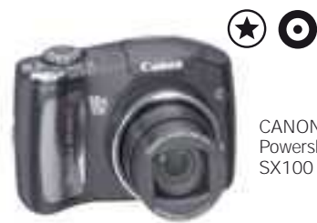
CANON Powershot SX100 IS